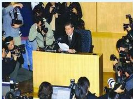
韩克隆之父因卵子丑闻辞职